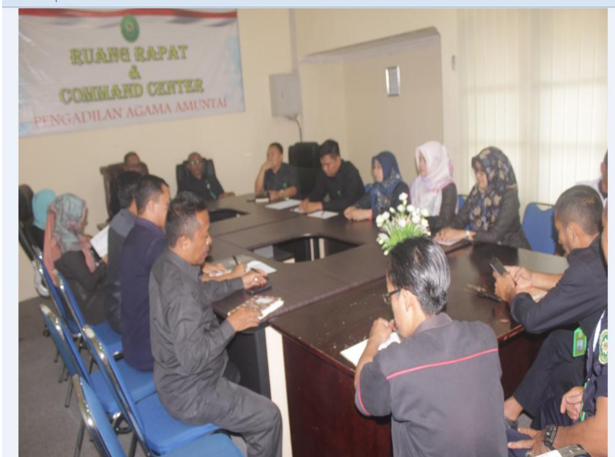
FOTO RAPAT MONEV KEBIJAKAN LAYANAN INFORMASI