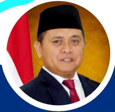
Prof. Dr. H.M Syarifuddin, S.H., M.H